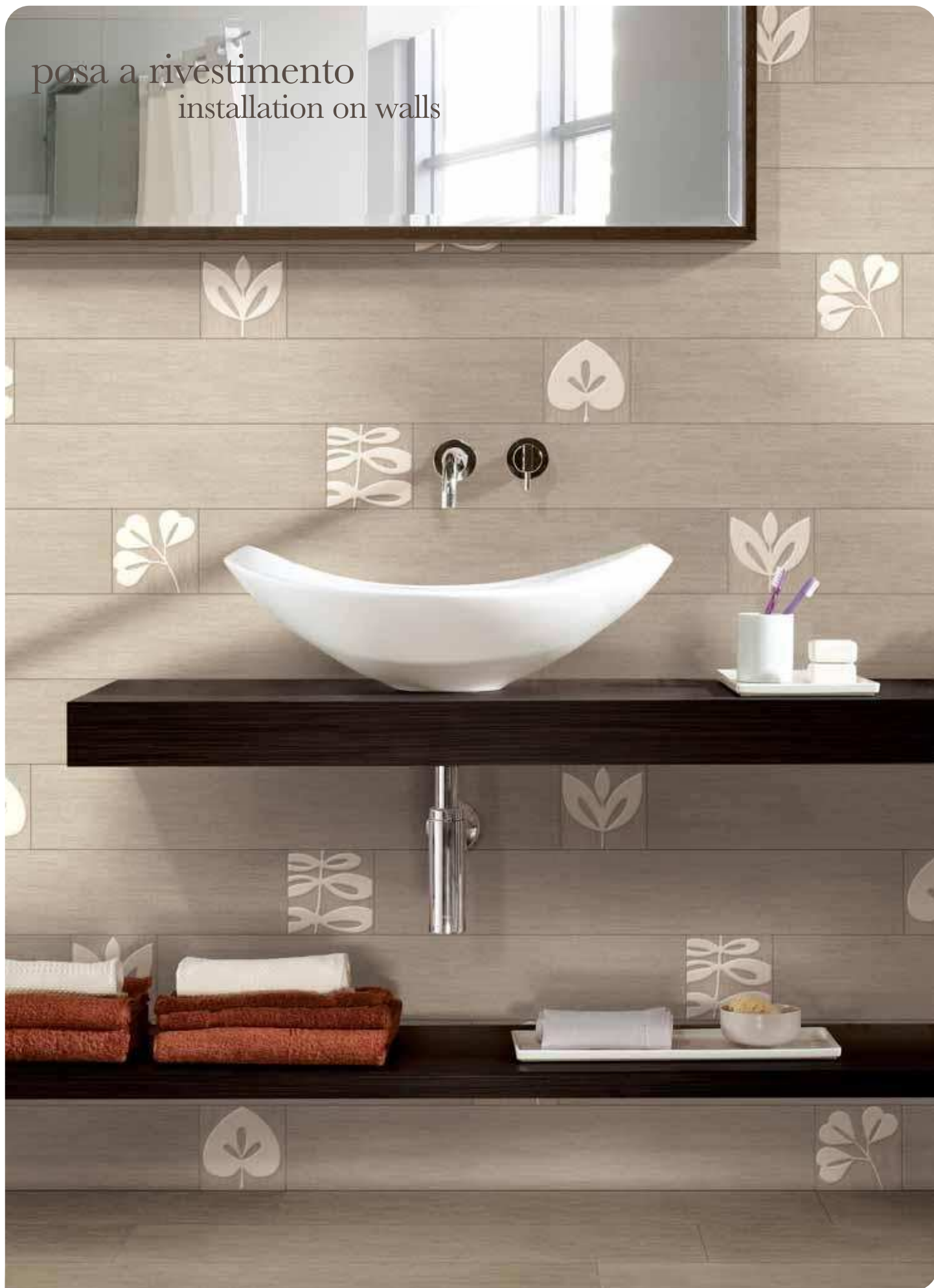
svezia slim/4 13x80 (5 1 / 8 "x31 1 / 2 ") - svezia decoro natural mix 4 13x13 (5 1 / 8 "x5 1 / 8 ")

posa a rivestimento installation on walls