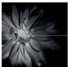
flower black comp/2 30x60 11 3/4 "x 23 5/8 " 727379