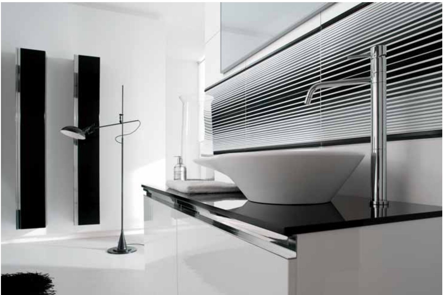
wall: white 30x60 11 3/4 "x 23 5/8 " - tipe 20x60 7 7/8 "x 23 5/8 " - decor dark list 2x60 3/4"x 23 5/8 " floor: black 60x60 23 5/8 "x 23 5/8 "