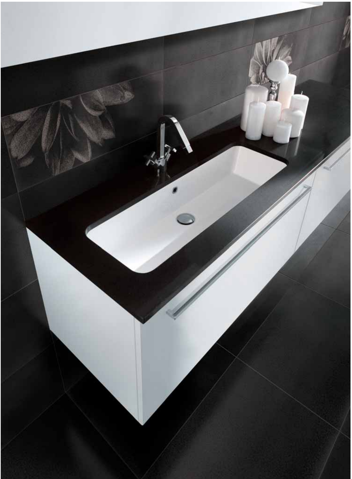
wall: black 30x60 11 3 / 4 "x 23 5 / 8 " - flower black comp/2 30x60 11 3 / 4 "x 23 5 / 8 " floor: black 60x60 23 5 / 8 "x 23 5 / 8 "