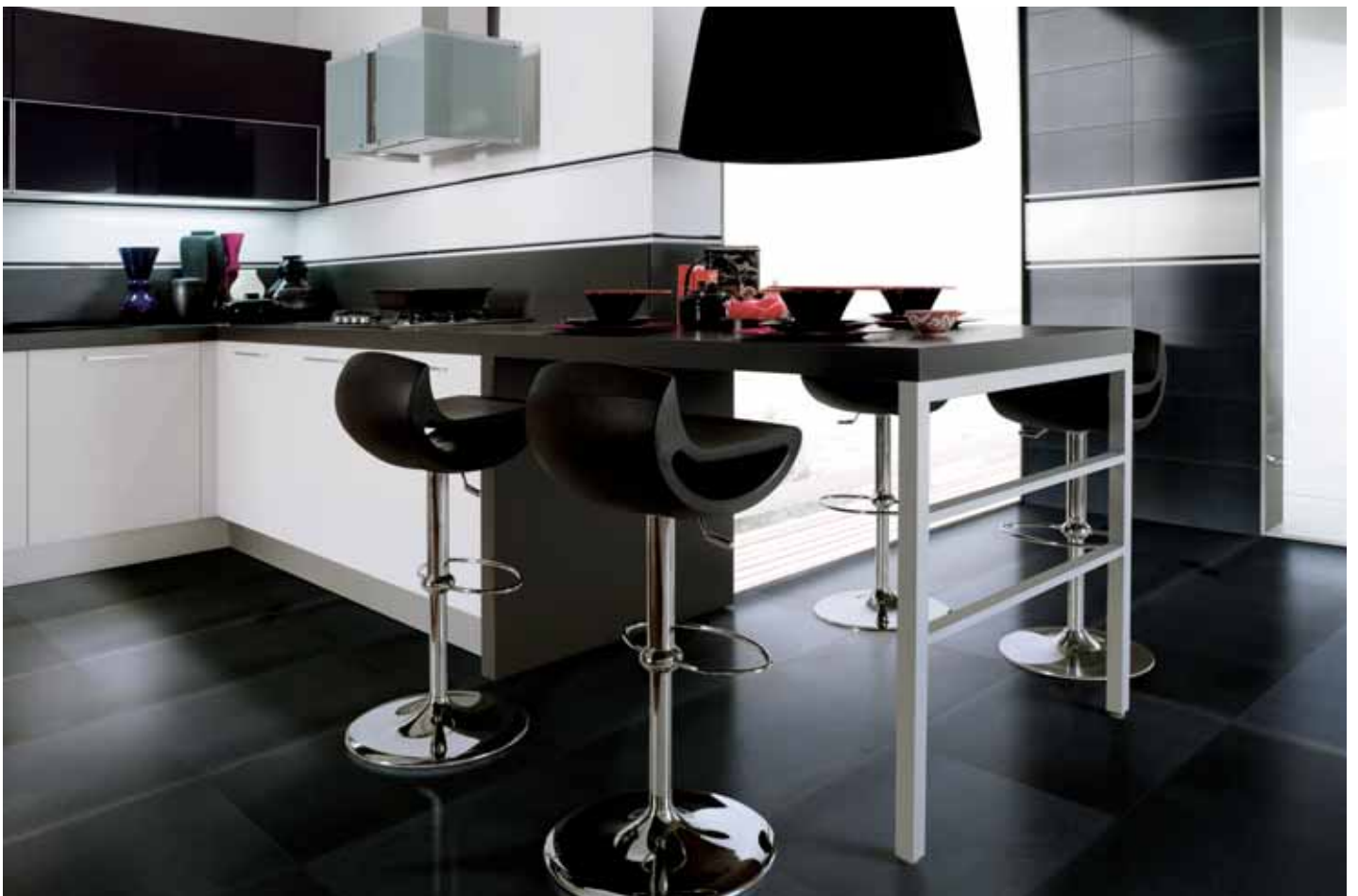
wall: white 30x60 11 3/4 "x 23 5/8 " - black 30x60 11 3/4 "x 23 5/8 " - decor white list 2x60 3/4"x 23 5/8 " - decor dark list 2x60 3/4"x 23 5/8 " floor: black 60x60 23 5/8 "x 23 5/8 "