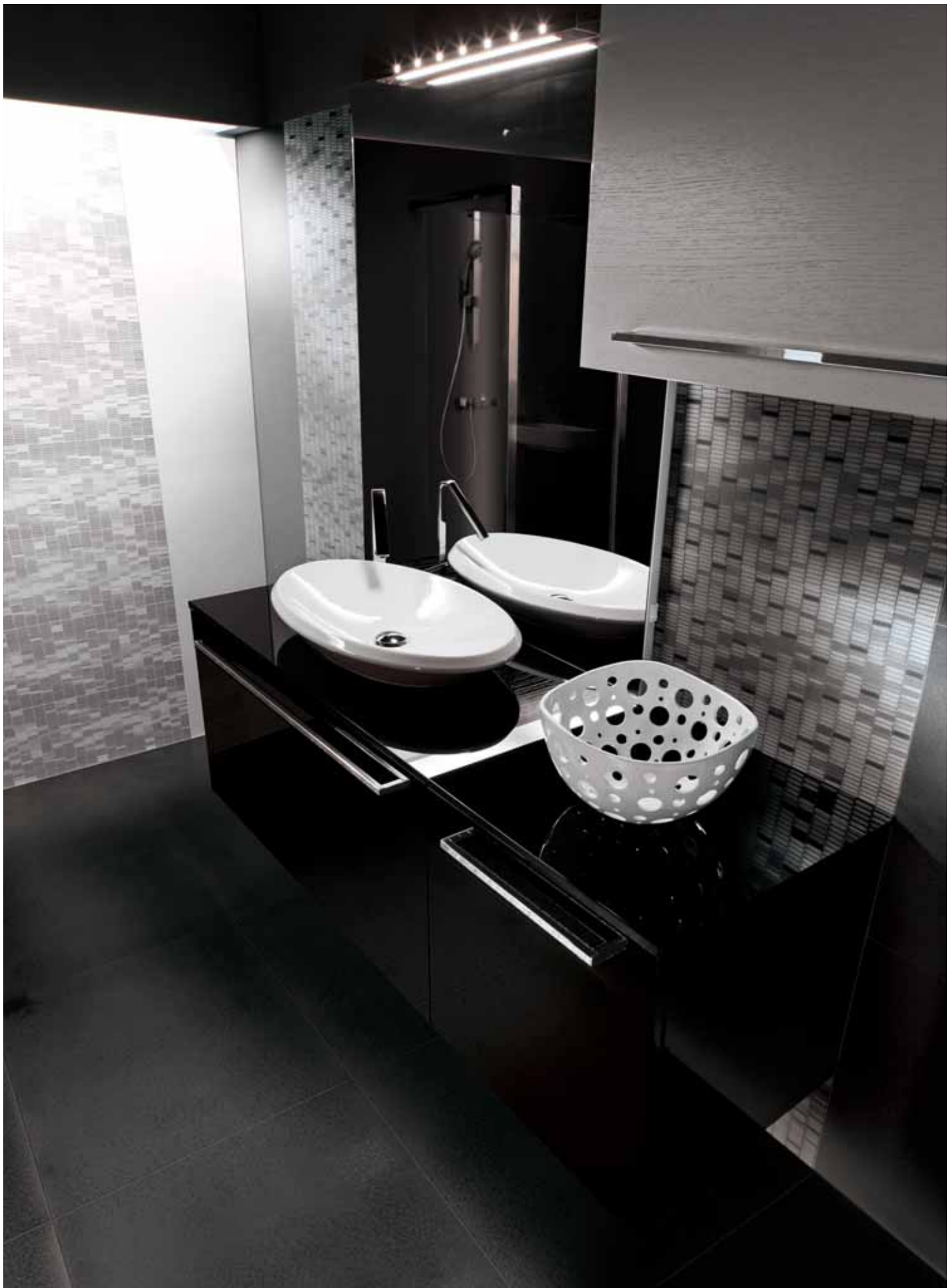
wall: black 30x60 11 3 / 4 "x 23 5 / 8 " - box black 30x60 11 3 / 4 "x 23 5 / 8 " - white 30x60 11 3 / 4 "x 23 5 / 8 " - box white 30x60 11 3 / 4 "x 23 5 / 8 " floor: black 60x60 23 5 / 8 "x 23 5 / 8 "