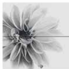
flower white comp/2 30x60 11 3/4 "x 23 5/8 " 727378